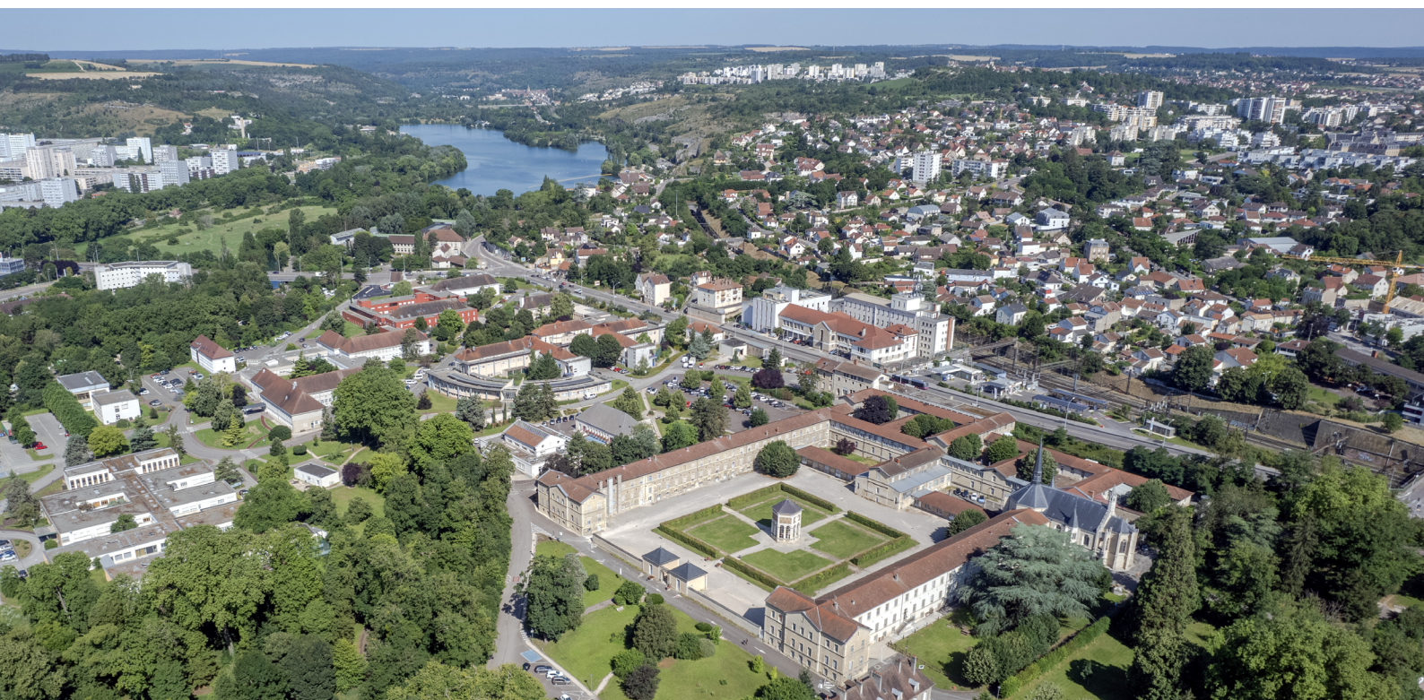
Vue aérienne du CH La Chartreuse (Dijon)